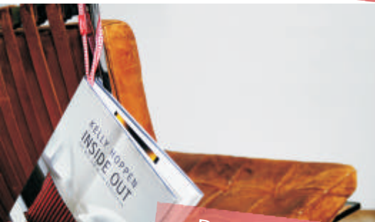
Das Lieblingsbuch an der Stuhllehne