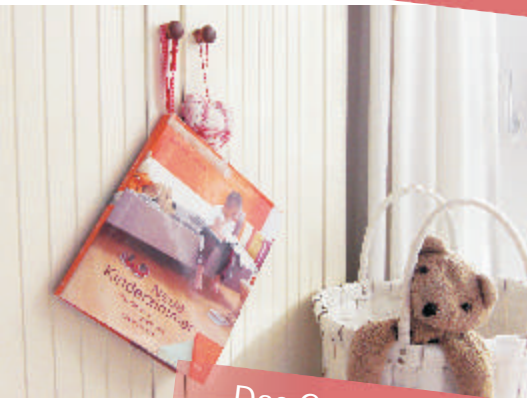
Das Gute-Nacht-Buch an der Schranktür