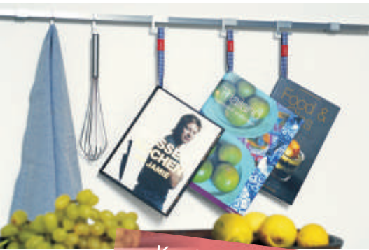
Kochbücher an der Küchenleiste